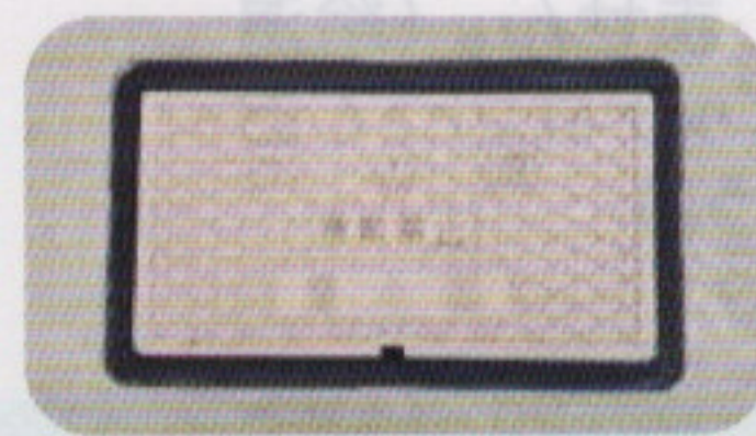
水道メーターボックス

*1 修理費用はお客さまのご負担となります。 *2 届出受付後、現地のメーターバルブを閉止封印し、水の供給を止めます。